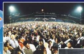
▲ 인도네시아 파푸아 손수건 집회