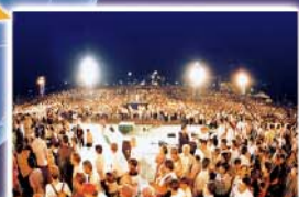
▲ 필리핀 연합대성회