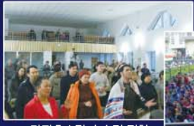
▲ 카자흐스탄 손수건 집회