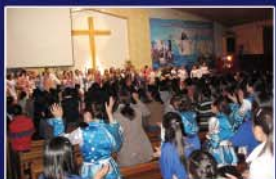
▲ 몽골 손수건 집회

특히 2002년 10월에는 인도 첸나이 마라나 해변에서 연인원 3백만 명 이상이 운집한 가운데 '인도 연합대성회'가 열렸다. 타밀라루 주 정부는 '강제 개종금지 규정'을 발표해 성회 개최를 휘방했으나 소경이 보고 귀머거리가 들으며 목발과 휠체어를 버리고 걷고, 에이즈(AIDS)가 치유되는 권능이 나타나 수많은 사람이 개종했다.