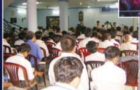
▲ 베트남 목회자 세미나