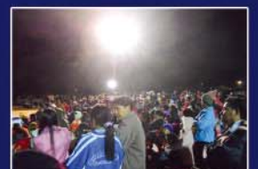
▲ 태국 손수건 집회