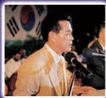
▲ 인도 연합대성회