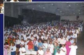
▲ 스리랑카 목회자 세미나