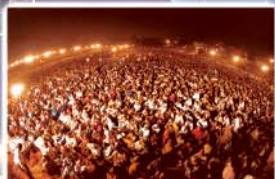
▲ 파키스탄 연합대성회