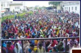
▲ 네팔, 부탄 손수건 집회