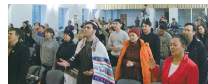
Las Reuniones del Pañuelo se llevaron a cabo en cinco regiones por todo Kazajstán, del 12 al 20 de marzo de 2010. Muchas personas tenían muchos deseos de escuchar el Evangelio de Santificación y las obras del poder de Dios, y el equipo misionero tuvo la experiencia de primera mano de la importancia de la obra de la misión literaria. (Alabando antes de la Reunión del Pañuelo en Karaganda el 15 de marzo).

Kazajstán: Una nación ubicada en el norte de Asia Central, su masa territorial ocupa el noveno lugar en el mundo. Su capital es Astaná y los idiomas oficiales son el kazajo y el ruso. La población del país es de 15'340.000 personas (desde 2008), de las cuales el 62% son musulmanes, el 35% ortodoxos rusos, y sólo alrededor del 2% son protestantes.