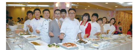
Voluntarios y Miembros de la Misión Luz y Luz prepararon comida para los invitados durante un evento de la iglesia.