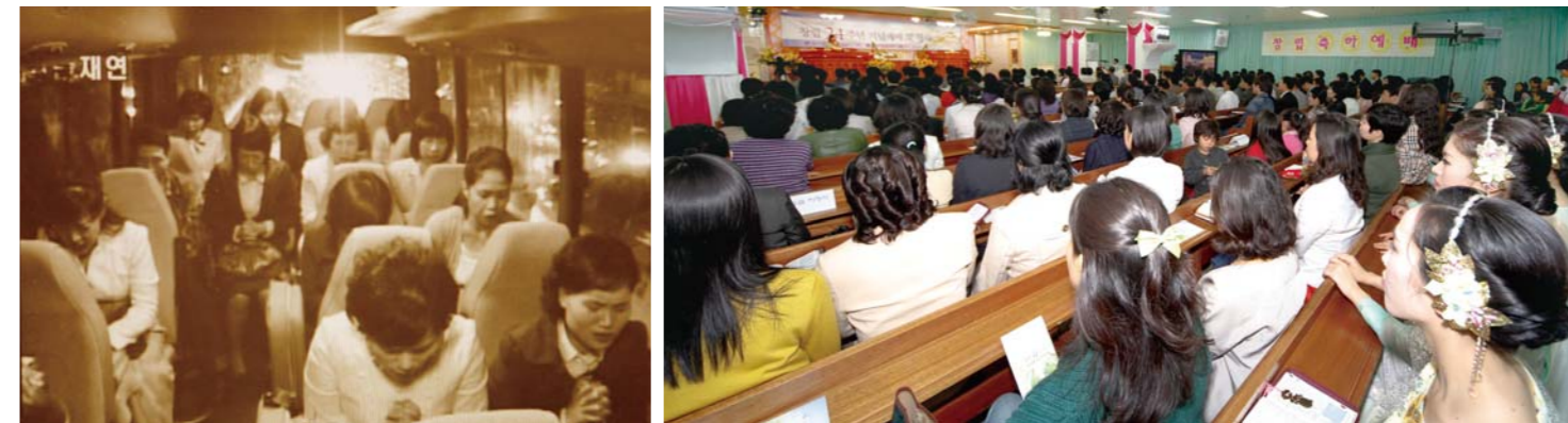
A la izquierda una antigua foto del grupo Misión Luz y Luz mientras adoran en el autobús de la iglesia. Ahora, luego de 24 años, ofrecen los servicios de adoración en su propio santuario ubicado en Daechi-Dong, Gangnam-Gu, Seúl (Foto tomada durante el servicio del XXIV Aniversario de la Misión Luz y Luz el 24 de octubre de 2009).