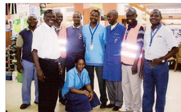
Junto al personal de NAKUMATT

Debido a que el Gerente General de NAKUMATT es de India, si se trabaja los domingos, pero mediante la Misión Sal y Luz (equipo misionero establecido para evangelizar a aquellos que trabajan los domingos en restaurantes y centros comerciales), yo me esfuerzo por evangelizar a mis obreros. Deseo agradecer a Dios quien derramó bendiciones sobreabundantes sobre mi vida y quien me dio fortaleza para superar los momentos difíciles de mi vida.