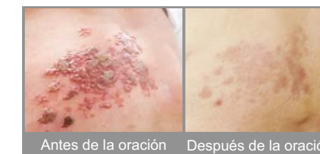
Antes de la oración Después de la oración