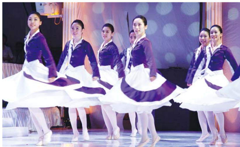
De “Alabanza de Poder de GCN”

Por otro lado, existe mucha música que describe de una manera hermosa los caminos