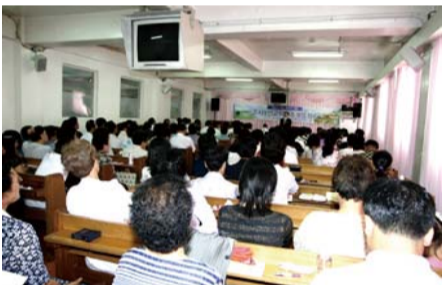
Reunión del Domingo a la mañana de ‘La Misión de Amor del Señor’

Entre los desertores pertenecientes a la elite, se encuentran graduados de las universidades de Corea del Norte quienes habían trabajado como agentes del gobierno, y quienes han encontrado puestos de trabajo estables y con una paga razonable en el gobierno de Corea del Sur y en instituciones de investigación. Pero también existen aquellos desertores con menos educación y menos experiencia profesional que hoy están confinados a recibir un salario muy bajo.