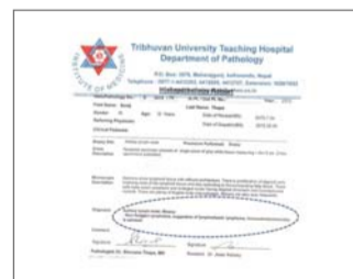
Biopsia de ganglios linfáticos mostró que tenía linfoma en tercera fase

Le doy todas las gracias y gloria al Dios vivo que bendijo a los miembros de mi familia con la oportunidad de la salvación a través de la enfermedad de mi hijo.