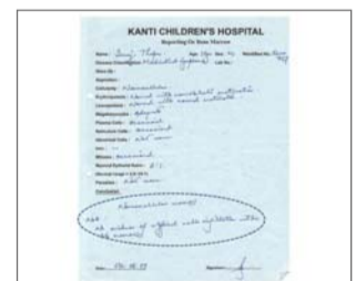
No se presenta linfoma en el examen de la médula ósea