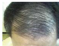
Septiembre 3, 2007

Es maravilloso poder escuchar los testimonios de las personas que han hecho lo mismo por fe, después de escuchar mi testimonio.