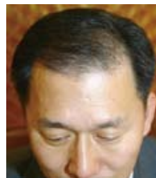
Octubre 29, 2007