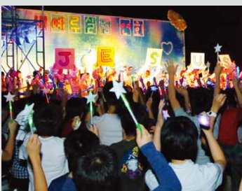
Campamento y fogata de alabanza y adoración