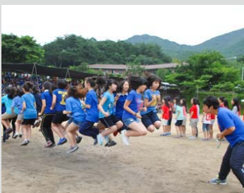
Encuentro deportivo de los estudiantes de Manmin