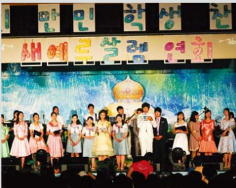
Concurso de Alabanzas de los estudiantes de Manmin