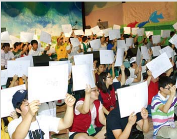
Concurso bíblico Campana Dorada de los estudiantes de Manmin