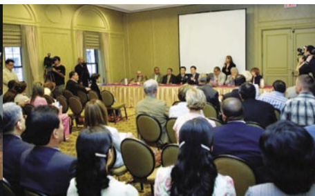
Conferencia de prensa