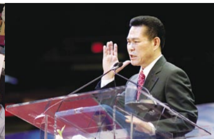
Mensaje de Vida