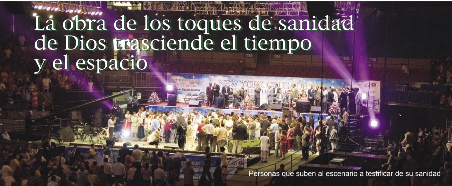
Personas que suben al escenario a testificar de su sanidad