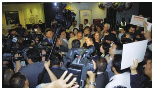
Entrevista en el Aeropuerto JFK