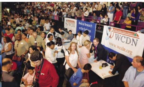
Verificación médica de los casos de sanidad por Médicos