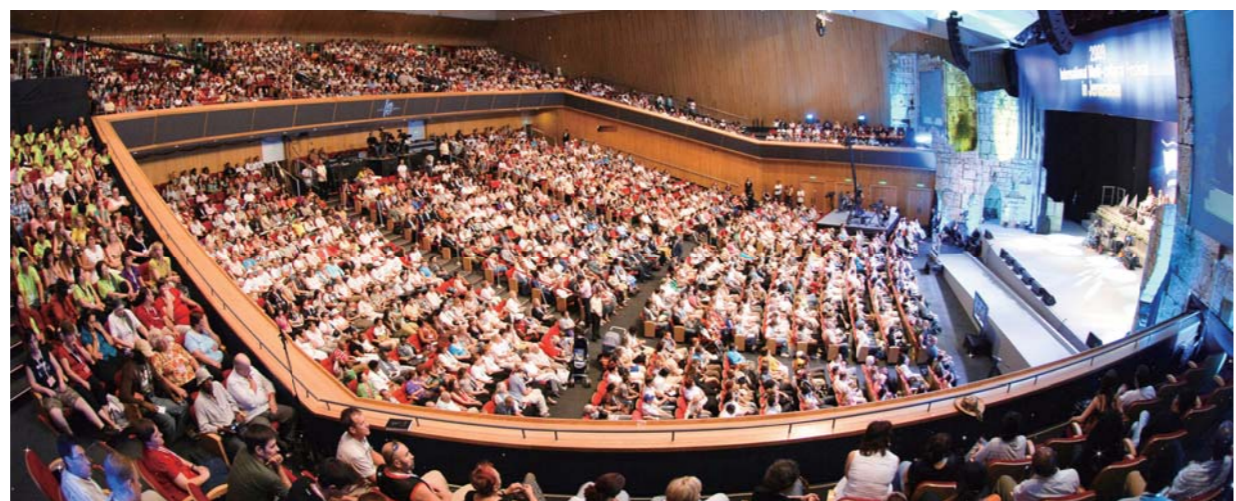
Прозвучавшая на прошедшем в Международном центре конгрессов в Иерусалиме (МЦК) «Объединенном крусиуде в Израиле - 2009» проповедь о том, что Иисус Христос есть Мессия, транслировалась в прямом эфире на 220 стран.