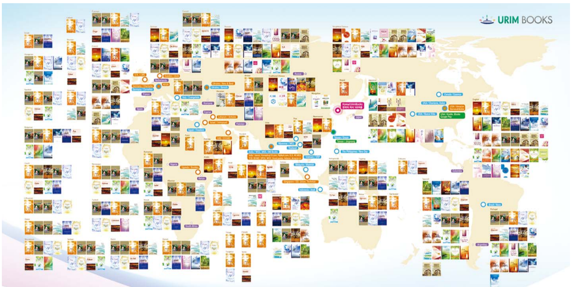
Báo cáo hình ảnh của Chức vụ truyền thông văn học cho mọi người trên toàn thế giới