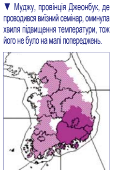
▼ Мужду, провінція Джеонбук, де проводився виїзний семінар, оминула хвиля підвищення температури, тож його не було на мапі попереджень.