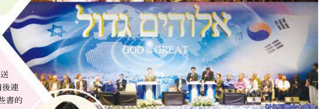
以色列聯合大盛會