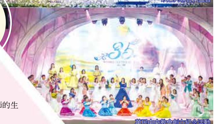
萬民中央教會創立紀念活動