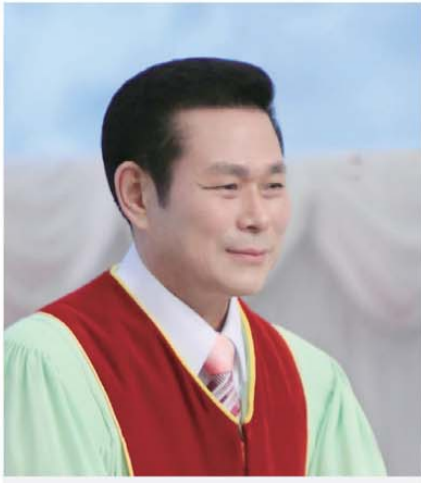
தலைமை போதகர். அறிவர். ஜேராக்கீ

ஆவியின் கனியோ அன்பு, சந்தோஷம், சமாதானம், நீடிய பொறுமை, தயவு, நற்குணம், விசுவாசம், சாந்தம், இச்சையடக்கம்; இப்படிப்பட்டவைகளுக்கு விரோதமான பிரமாணம் ஒன்றுமில்லை.” (கலாத்தியர் 5:22-23).