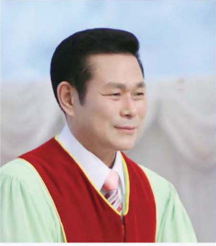
தலைமை யோதகர். அறிவர். ஜேராக்கல்

என்னைச் சீநேகிக்கிறவர்களை நான் சீநேகிக்கிறேன்; உதிகாலையில் என்னைத் தேடுகிறவர்கள் என்னைக் கண்டலடவர்கள்” (நீதிமொழிகள் 8:17)