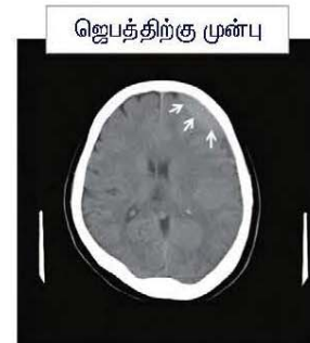
இடது மூளையின் முன்மடலில் வளர் பிறை சந்திரனைப் போன்று கிரத்தக் கசிவு இருந்தது.

நான் மறுபடியும் பிறந்தேன். நான் என்னுடைய கய-நீதியை உடைத்து, மற்றவர்களை தாழ்மையோடும் களிவோடும் கருதும் படியாக முயற்சி செய்துக் கொண்டு வருகிறேன். நான் மிகுந்த சந்தோஷத்தை உணருகிறேன். ஆவியிலும், சரீரத்திலும் என்னை ஆசீர்வதித்த தேவனுக்கு நான் சகல நன்றிகளையும், மகிமையையும் செலுத்துகிறேன்.