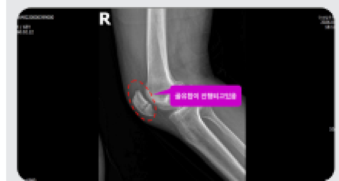
기도받은 후 X-ray(2026.01.06)