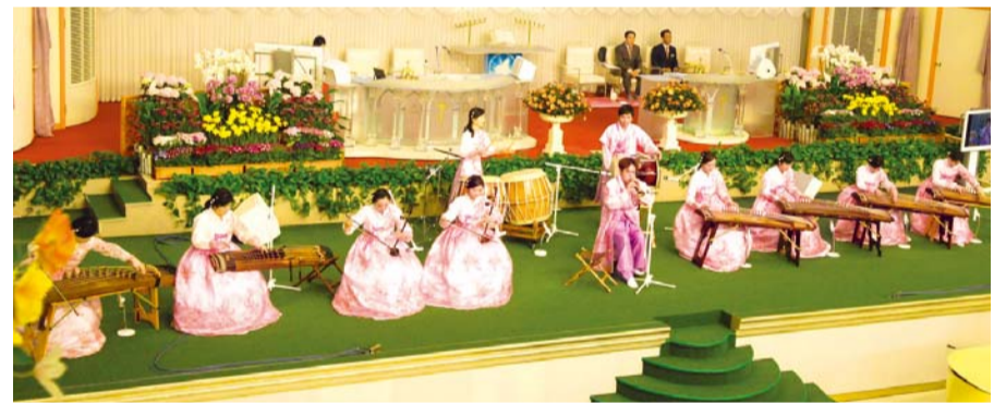
Ang grupo ng Serem Korean Traditional Music, naghahandog ng espesyal na pagtatanghal

Nagpapasalamat ako sa Diyos na nagbigay sa akin ng malaking pagpapala at nagligtas sa akin na nakatakang mamatay. Binigyan Niya ako ng pag-asa para sa Bagong Jerusalem. Hallelujah!