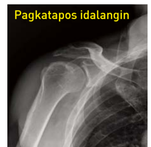
Muling nabuo ang mga butong nadurog, parang inoperahan, at ang butong nalinsad ay bumalik sa normal.