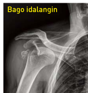
Dahil sa pinsala sa labas, nalinsad ang buto sa balikat, ang ibang buto ay nadurog.

Panataगत kumportable ako habang nananalangin. Kinagabihan, hinubad ko ang isinusuot na proteksyon dahil bumalik na sa normal ang kalagayan ko. Hallelujah!