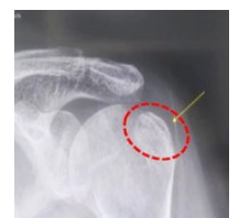
Después de la oración: Sinartrosis de la parte fracturada.