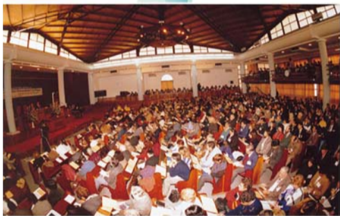
Seminarul pentru pastori din Argentina 1996

De asemenea, am experimentat lumea spirituală. Ochii mei spirituali s-au deschis și am văzut îngeri mai înalți decât copacii, așezați în formă de semilună la locul din care țâșnea apa dulce de Muan. Am văzut soarele înconjurat de un curcubeu, soarele cum se rotea și imaginea unei inimi în mijlocul soarelui. Pe lângă asta, am văzut cum soarele parcă se fragmenta ca celulele embrionilor care se divizează și am înțeles că cuplurile infertile vor putea avea copii când vor bea apă dulce de Muan. Sunt convins că această apă dulce de Muan are în ea puterea recreării.