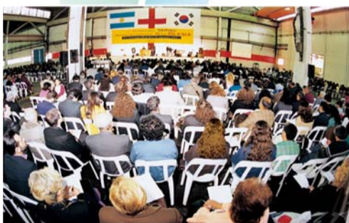
Seminarul pentru pastori și Întâlnirea de trezire spirituală din 1997, Argentina

◆ Cum v-ați simțit la prima vizită la Biserica Centrală Manmin?