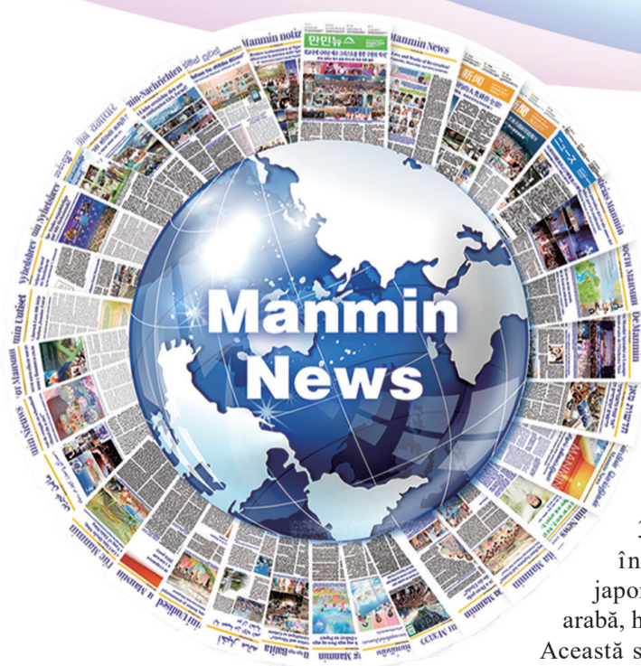
▲ Știrile Manmin sunt publicate în 33 de limbi.

Scrisoarea Știrile Manmin, care a condus oameni din întreaga lume pe calea mântuirii prin Cuvântul vieții și prin lucrări puternice, și-a sărbătorit cea de-a 31-a aniversare. Prima ediție a fost publicată pe 17 mai, 1987, iar ediția în limba engleză a fost publicată