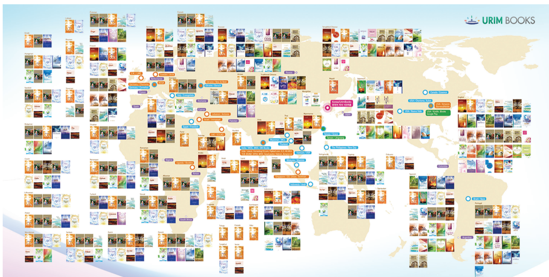
Raport în imagini a lucrării de publicații creștine pentru oamenii din întreaga lume