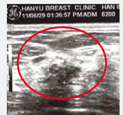
După rugăciune: a rămas doar o umbră