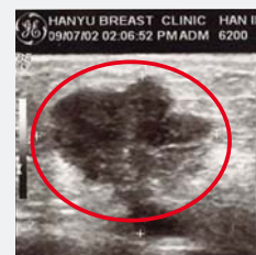
Înainte de rugăciune: nodul de 2,5 cm

În 10 iunie 2011, Dr. Jaerock Lee s-a rugat pentru mine în timpul Întâlnirii Divine Speciale de Vindecare. După aceea, durerea a dispărut și tumoarea s-a micșorat. În 29 iunie, la restestare, s-a văzut că nu mai aveam cancer la sân. Aleluia!