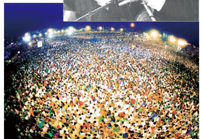
A Cruzada Unificada da Índia de 2002 contou com a participação de mais de três milhões de pessoas. Durante a cruzada, uma seca severa teve o seu fim. Muitas pessoas foram curadas e se converteram ao cristianismo.