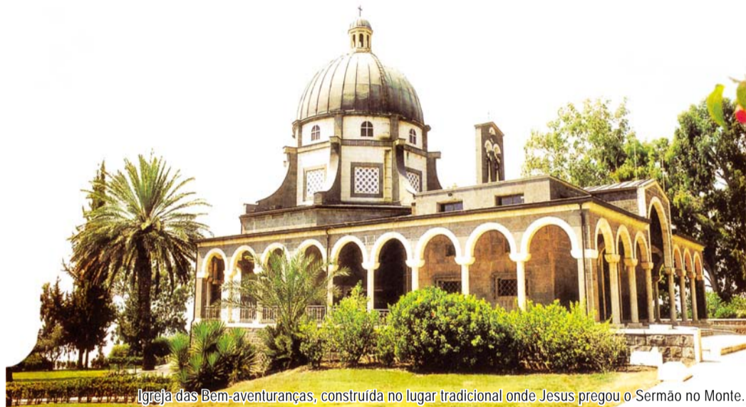
Igreja das Bem-aventuranças, construída no lugar tradicional onde Jesus pregou o Sermão no Monte.

No topo da montanha, Jesus pregou a preciosa mensagem do ‘Sermão da Montanha’ à multidão. Àquelas pessoas que logo desapareceriam como a neblina Jesus ensinou sobre a bênção eterna, isto é, as verdadeiras bênçãos para se entrar no reino do céu. Essa mensagem contém as ‘Bem-Aventuranças’, e serve como um padrão para examinarmos a nós mesmos e entrarmos no lugar onde fica o trono de Deus – a Nova Jerusalém. Vamos estudá-las então!