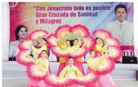
Apresentação do Grupo de Dança Adoração de Poder na Cruzada Lenço de Poder, em Carabayo