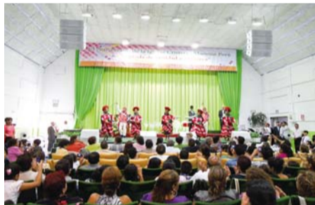
Culto do 6º Aniversário da Igreja Manmin do Peru