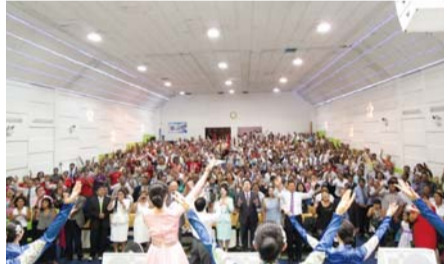
Tempo de louvor no Seminário de Pastores realizado na Igreja Manmin no Peru