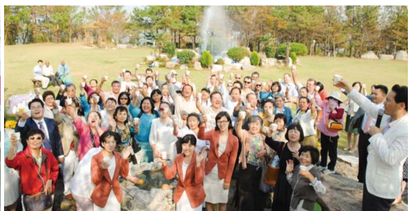
परमेश्वरको शक्ति प्रकट भएको मुआन स्वीट वाटर क्षेत्र घुम्दै (मुआन, जियोन्नाम प्रान्त, कोरिया)