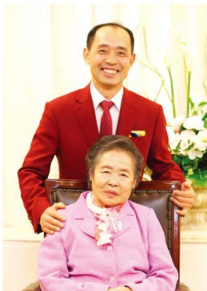
И Чан хи сүмд үйлчлэгч (52нас, Хятад 3-р бүлэг)

Өмнө нь “Яагаад би л ингэж зовох ёстой юм” гэж байсан бол “Амьдрал ийм аз жаргалтай юм уу” гэж өөрөө гайхах хэмжээнд хүрсэн юм. Энэ бүх зүйл амийн сургаал ба Эзэний л ивээл юм. Одоо илүү гүнзгий яс маханд тулгал өөрчлөгдөхийг хүсэх тэмүүлэл өгч, цаг мөч бүр ивээл дотор амьдруулж өгсөн сайн Бурхандаа бүх талархал ба алдрыг өргөө.