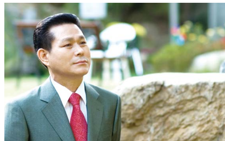
Доктор И Жэй руг

“Үзэгтүн, Би бол Эзэн, бүх махан биеийн Бурхан. Надад ямар нэгэн зүйл дэндүү хэцүү юу?” (Иеремиа 32:27)