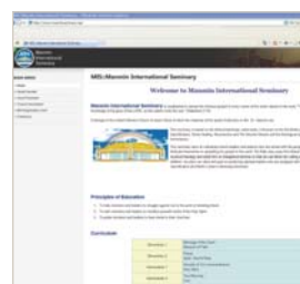
Манмин Олон Улсын Семинарын (MIS) вебсайт

Манмин Төв Сүмтэй хамтран ажиллах хүсэл төрцөгөөдөг билээ. Олон зуун сүмүүд манай сүмийн салбар болон эсвэл хамтран ажиллах хүсэлтэй юм. MIS-ын төв нь Сөүлд байрладаг ба Белги, Англи, Орос, Энэтхэг, Хятад, Тайван, АНУ, Перу бусад орнуудад салбаруудтай билээ. Оюутнууд онлайнор лекцүүдийг сонсож мэдэх боломжтой юм. Эрхэм та MIS-ыг www.manminseminary.org хаягаар орон гишүүнээр бүртгэлд бүртгүүлж болно. Тус