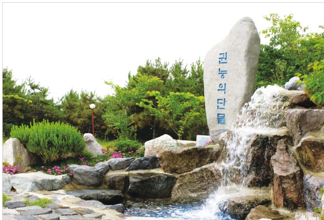
Өнөөдөр Жеоннам Мужын Муан-гун Хаежа-муийн Чунжанг-ригийн Сан 153-д орших Муан Манмин Сүм дээр Бурханы агуу гайхамшигийн хүчээр далайн шорвог ус амтат ус болсныг үзэхээр маш олон Христэд итгэгч хүмүүс ирцгээдэг юм.

Далайн шорвог ус амтат ус болон Хувирсан ба Ариун Сүнсний Үйл Ажиллагаа Илчлэгдсэн нь