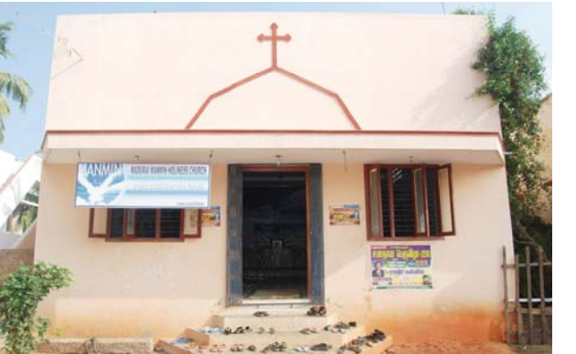
Мадурай Манмин Сүм