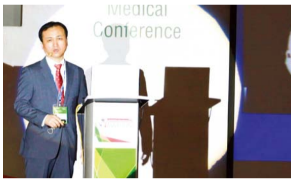
Өмнөд Солонгосоос ирсэн өвчтөн Өвчин: Тархины цус алдалт Илтгэгч: Чей Юун сог Доктор (Мэс засалч)