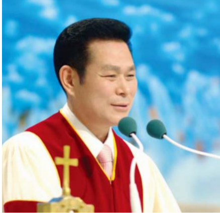
Доктор И Жей руг Тэргүүн Пастор

“Хэрэв би хүмүүсийн болон тэнгэр элч нарын хэлээр ярьсан ч надад хайр байхгүй бол нүргэлэх харанга, хангинах цан болох байсан. Хэрэв би эш үзүүлэх чадвартай, мөн бүх нууцууд болон бүх мэдлэгийг мэддэг байгаад, уулыг нүүлгэх бүрэн итгэлтэй байлаа ч, надад хайр байхгүй бол би юу ч биш. Хэрэв би өөрийн бүх л өмч хөрөнгөө тараан өгч, өөрийн биеийг шатаахаар тушаасан ч надад хайр байхгүй бол энэ нь надад ямар ч ашиггүй юм” (1Коринт 13:1-3).