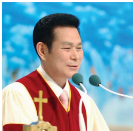
Доктор И Жей руг Тэргүүн Пастор

Есүс хариуд нь – “Үнэнээр, үнэнээр Би чамд хэлье. Хэн дээрээс эс төрнө, тэр хүн Бурханы хаанчлалыг үзэж чадахгүй гэхэд Никодем Түүнд -Настай болсон атлаа хүн хэрхэн төрөх билээ? Хүн эхийн хэвлийд хоёр дахиа орж, төрж чадна гэж үү? гэлээ. Есүс-Үнэнээр, үнэнээр Би чамд хэлье. Хэн ус болон Сүнснээс эс төрнө, тэр хүн Бурханы хаанчлалд орж чадахгүй” (Иохан 3:3-5).