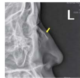
▲ Эдгэрэхээс өмнө: Хамрын мөгөөрс гэмтсэн байдал

Бурхан миний итгэлийг хараад ихэд баярлан таалж, Бүтээгч Бурханы эрх мэдэлт хүч чадлаар асар хурдан эдгээж өгсөн юм. Тэр ч байтугай өмнөхөөс ч илүү эвтэйхэн хөөрхөн хэлбэртэй богож өгсөн учраас үнэхээр их талархаж байна. Ариун Гурвал Бурхандаа бүхий алдар ба магтаалыг өргөн, миний төлөө залбирал хийж өгсөн И Жей руг тэргүүн пасторгаа талархсанаа илэрхийлье.