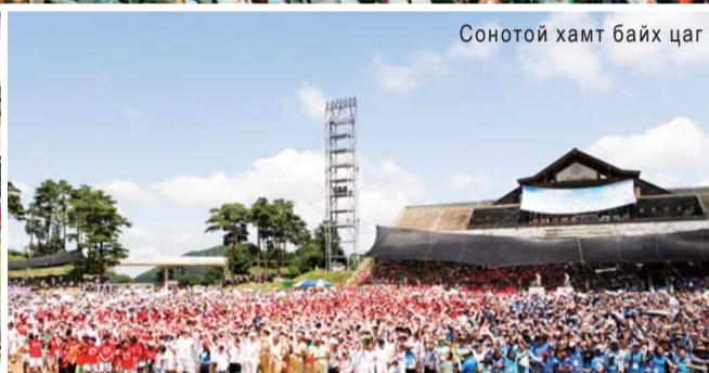
Сонотой хамт байх цаг