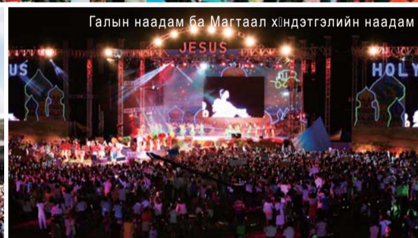
Галын наадам ба Магтаал хиндэтгэлийн наадам

2012 оны 8-р сарын бны өдөр, “Манмин сүмийн Эрэгтэй, Эмэгтэйчүүдийн багийн Зуны цуглааны үйл ажиллагаа” Жонбуг мужын Мүжү хэмээх газарт орших Догюусан амралтын газарт болж өнгөрлөө. Итгэгчид хоёр шөнө, гурван өдрийн турш болж өнгөрсөн энэхүү үйл ажиллагааны төрөл бүрийн хөтөлбөрөөр дамжуулан Сүнс болох Бурханы тухай суралцан итгэлээ өсгөсөн юм.