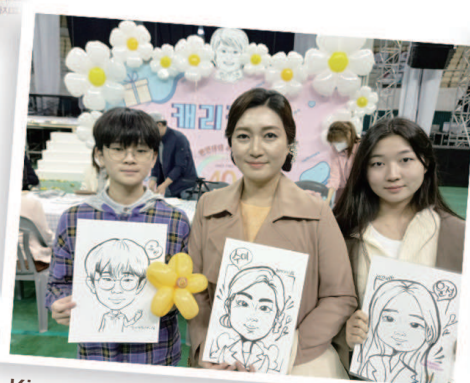
Kios karikatur yang menggambarkan sifat anggota Manmin