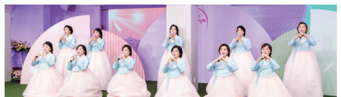
▲ Hadiah emas / Koir Serem (Misi Wanita)