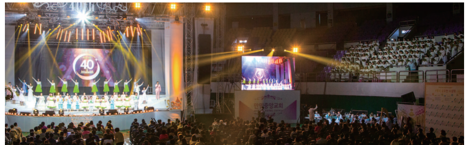
Finale/ Semua anggota persembahan memberi kesyukuran dan kemuliaan kepada Tuhan Tritunggal yang telah memelihara dan melindungi gereja kita sehingga ulang tahun ke-40