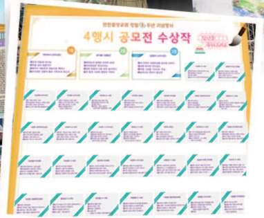
33 karya yang memenangi Peraduan Puisi Empat Baris