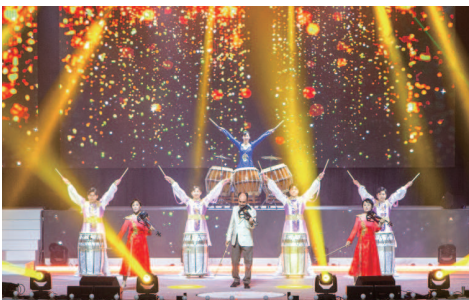
Adegan 5. Persembahan Muzik Kemenangan Persembahan gendang dan alat muzik bertali elektronik dengan kesyukuran atas karya Roh Kudus yang berapi-api