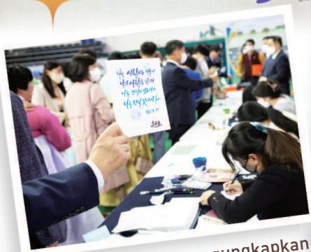
Kios kaligrafi yang mengungkapkan perasaan bagi perkataan-perkataan yang dipilih