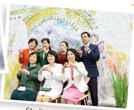
Studio yang dihias cantik dan studio foto pelekat empat potongan