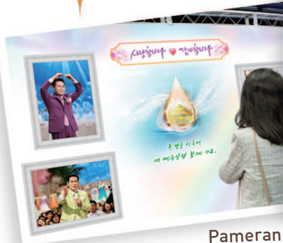
Pameran Foto Manmin di mana kita dapat melihat 40 tahun sejarah Manmin dengan sekilas pandang