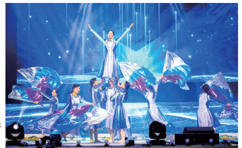
Adegan 6. Karya Kuasa Tarian penyembahan dipersembahkan kepada Tuhan yang telah dimulakan melalui kuasa-Nya yang besar