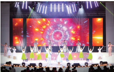
Adegan 7. Kemeriahan Ulang Tahun Pujian beramai-ramai dipersembahkan oleh semua anggota Manmin kepada Tuhan