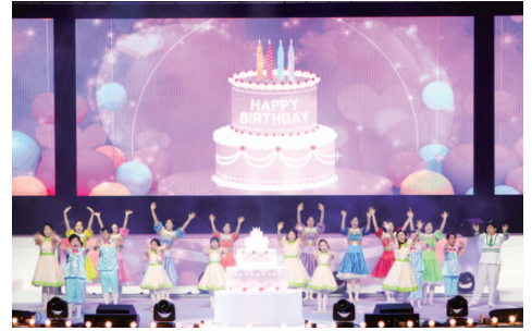
Adegan 2. Sambutan Ulang Tahun Persembahan meraikan ulang tahun ke-40 dengan satu minda