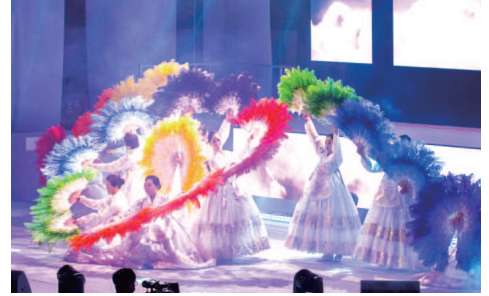
Adegan 4. Tarian Kemenangan Tarian kipas tanda kesyukuran atas kedamaian sejati yang diberikan selama 40 tahun