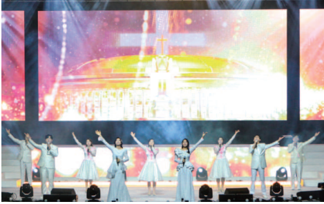
Adegan 3. Pujian Kemenangan Pujian syukur kepada Tuhan yang menyertai pelayanan Manmin