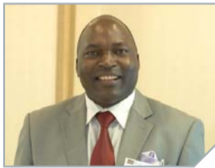
Bishop Olumasai Nicholas Omutyangoli, Ketua Kabar Penginjilan Gereja Kenya

Saya sangat tersentuh ketika mendengar bahwa tempat di surga akan di bagi menurut ukuran iman setiap pribadi. Disamping itu, Injil kekudusan mengajari saya cara untuk menjadi seorang Kristen yang benar yang sungguh mengasihi Tuhan. Saya membagikan ini kepada 65 Pastor di denominasi saya, dengan persetujuan mereka kami bergabung dengan Manmin.