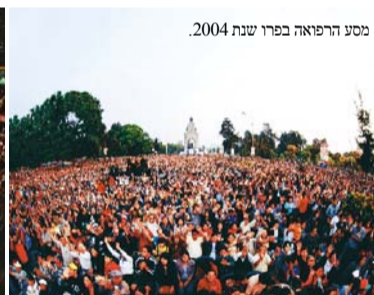
מסע הרפואה בפרו שנת 2004.