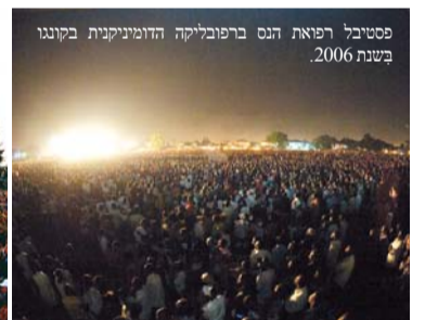
פסטיבל רפואת הנס ברפובליקה הדומיניקנית בקונגו בשנת 2006.