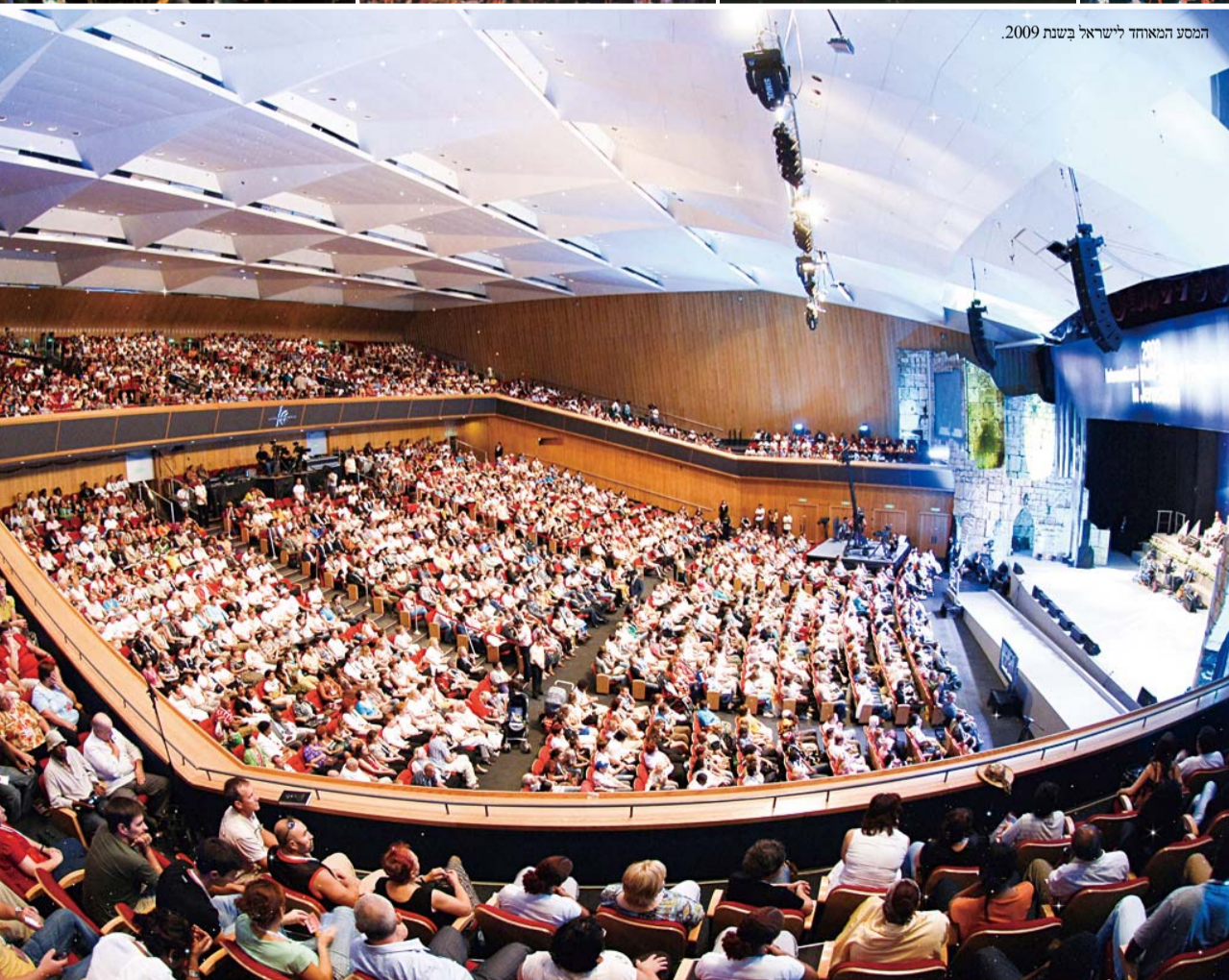
המסע המאוחד לישראל בשנת 2009.