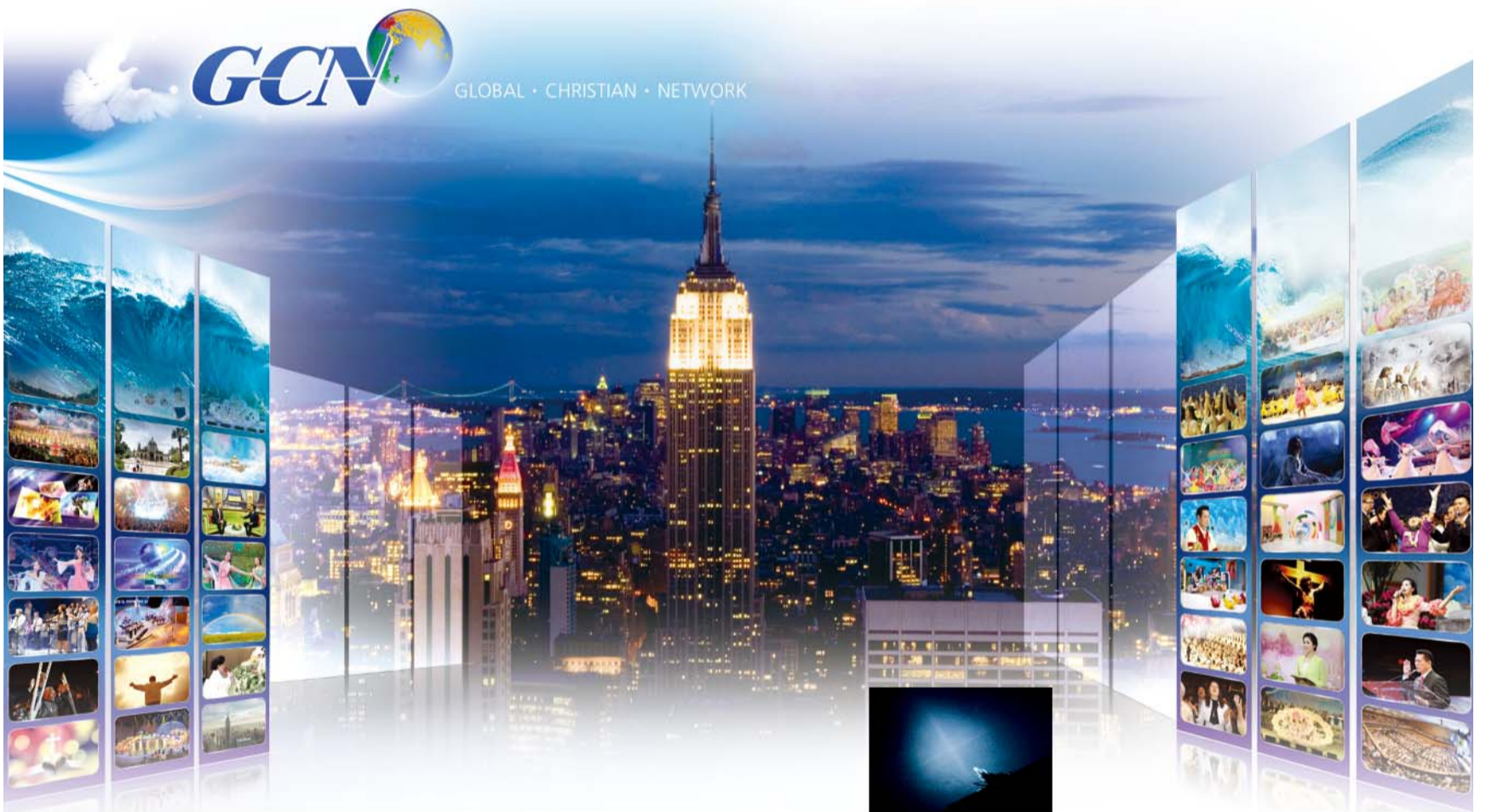
ביום הקמת הרשת המשיחית העולמית נראה ממשכן שידוריה: בשמים מעל בניין האמפייר סטייט: צלב זוהר.

טלויזיה משיחית לצופים בלמעלה מ 170 מדינות.