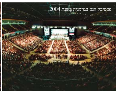
פסטיבל הנס בגרמניה בשנת 2004.