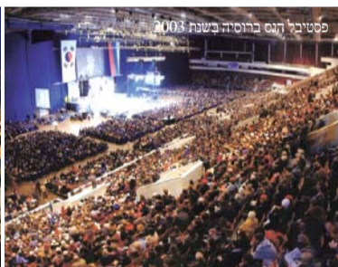
פסטיבל הנס ברוסיה בשנת 2003.