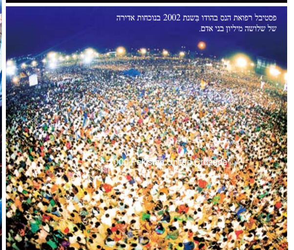
פסטיבל רפואת הנס בהודו בשנת 2002 בנוחות אדירה של שלושה מיליון בני אדם.