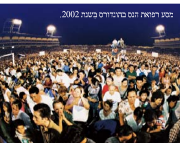
מסע רפואת הנס בהונגקונג בשנת 2002.

השגחתו הַאֲדִירָה של אלוהים להושיע לא רק את חברי קהילת מאן מין – אלא אף את כל בני האדם בכל העולם – היתה כבר בלב האב. הגיע הזמן להִשְׁוֹף בקריצות את השגחתו לאחרית הימים – אשר נשמרה בליבו. במובן זה: עד כה עשה אלוהים כמה הכנות. להִשְׁוֹף בקריצות את השגחתו לתשועת כל