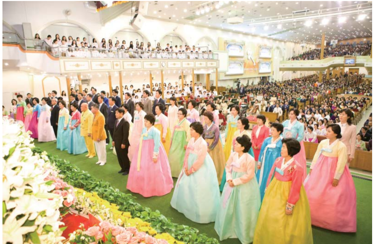
44 auhinna saanud inimest tegid 2015. aastal Isanda ihu liikmetena ustavalt rõõmu ja tänuga tööd: 4 piirkondlikku juhti, 3 alapiirkonna juhti, 4 kodugrupi juhti kihelkondades, 1 rühmajuhth ja 4 väikerühma juhti misjonitööl, 6 komitee liiget, 4 vabatahtliku rühma liiget, 13 täisajaga töötajat ja 5 vabatahtlikku.