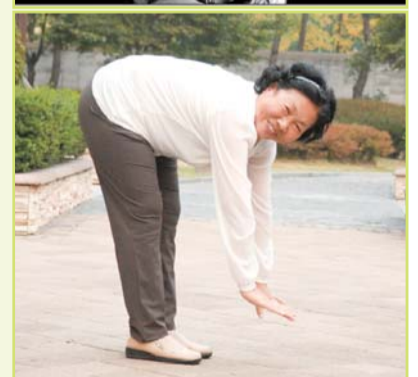
Pärast palvet tervenesis ta närvidele survet avaldavast L4 ja L5 diski songast