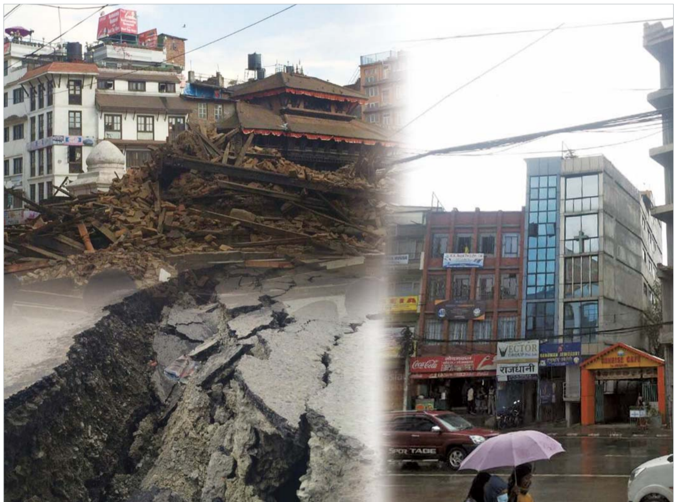
Tuhandet inimest kaotasid elu Nepaali suures maavärinas. Palugem, et suuremat kahju ei tekiks ja inimesed ei kannataks edasise trauma tõttu. Lisaks saagem Jumala õnnistatud lasteks, kes on alati Tema kaitsealused ja austagem Teda.