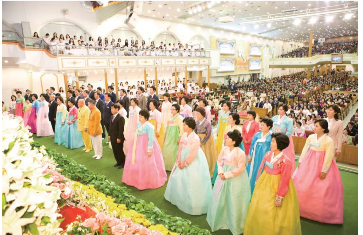
Er waren 44 personen die een eerbewijs ontvingen omdat ze getrouw hadden gewerkt met vreugde en dankbaarheid in 2015, als leden van het lichaam van de Heer: 4 districtleiders, 3 sub-districtleiders; 4 huisgroepleiders; 1 groepsleider en 4 kleine groep leiders in zendingen; 6 bestuursleden; 4 leden van de vrijwilligersgroep; 13 fulltime medewerkers, en 5 vrijwilligers.