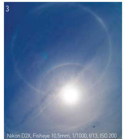
Nikon D2X, Fisheye 10.5mm, 1/1000, f/13, ISO 200

Sommerrefugiet og missionsrejserne. Den første cirkulære regnbue, som omkransede solen, viste sig over Centralkirken den 15. maj 1998.