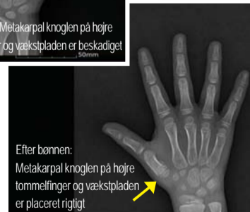
Efter bønnen: Metakarpal knoglen på højre tommelfinger og vækstpladen er placeret rigtigt.