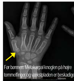
Før bønnen: Metakarpal knoglen på højre tommelfinger og vækstpladen er beskadiget.