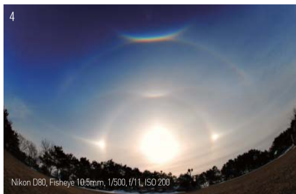
Nikon D80, Fisheye 10.5mm, 1/500, f/11, ISO 200

Men der har konstant været regnbuer over Centralkirken og Manminkirkerne i og udenfor Korea, når der har været særlige arrangementer, og desuden under mange udendørs arrangementer såsom