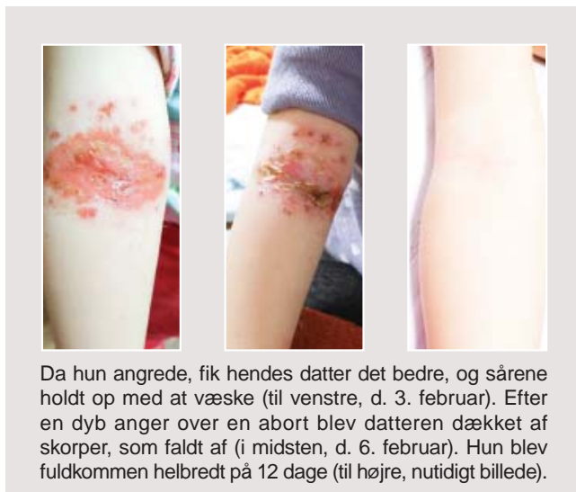
Da hun angrede, fik hendes datter det bedre, og sårene holdt op med at væske (til venstre, d. 3. februar). Efter en dyb anger over en abort blev datteren dækket af skorper, som faldt af (i midsten, d. 6. februar). Hun blev fuldkommen helbredt på 12 dage (til højre, nutidigt billede).