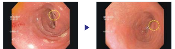
Litrato sa Gastroscop

▲ Sa wala pa ang pag ampo: lawum og grabing duodenal ulcer tumong sa ala-una nga direksyon. ▶ Human sa pag ampo: duodenal ulcer nalimpyo sa walay pag inom og tambal.