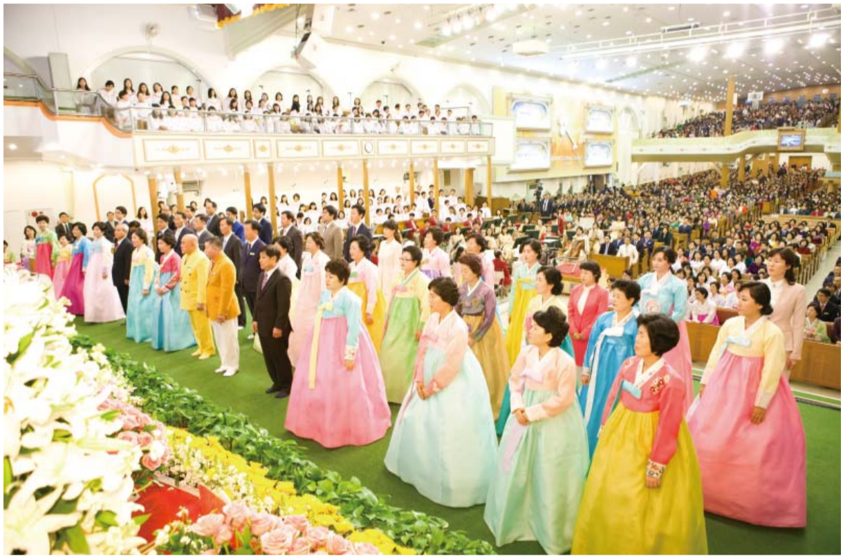
Dihay 44 awardees nga matinud anong nag trabaho uban ang kalipay og pasalamat sa 2015 isip miyembro sa lawas sa Ginoo: 4 district leaders, 3 sub-district leaders, 4 cell leaders sa parishes; 1 group leader og 4 ka small group leaders sa misyon; 6 committee members; 4 volunteer group members; 13 ka full-time workers og 5 ka volunteers.