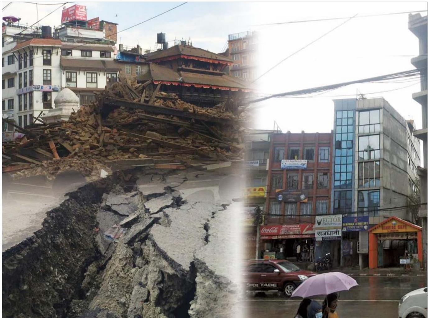
Ang dakong linog sa Nepal nikuha sa liboan ka mga kinabuhi sa tawo. Atong iampo nga wala nay kadaot pa og ang mga tawo dili na mag antos pa sa troma. Dugang ini, maningkamot tang mahimong bulahang mga anak nga perming ma protektahan Niya og ato Siyang himayaon.

Diha sa mga kalamidad, ang katawhan walay mahimo og daling mapukan. Apan, kung ang mga anak sa Dios motoo sa Dios, mag praktis sa Iyang Pulong uban ang paghigugma Kaniya, og maglakaw sa kahayag, pinaagi ini dili sila mawad-an og kalinaw. Sama nga ang Dios ni protekta sa mga Israelita didto sa Goshen sa mga kadaot nga miabot sa tibuok Ehipto, karon Iya usab gitugot