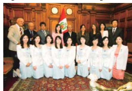
Ang pagbisita sa mission team ngadto sa National Assembly Building sa Peru

Nianang panahona, daghang mga bakol namarog sa ilang wheel chair og naglakaw-lakaw atol sa miting. Nanaka