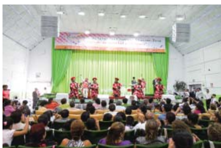
Ang Peru Manmin Church sa ilang ika-6 nga Anniversary Service