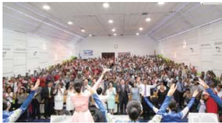
Ang praise team sa Pastors' Seminar nga gihimo sa Peru Manmin Church