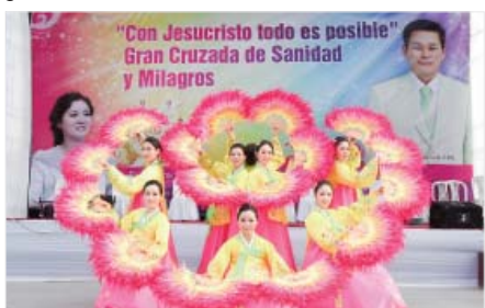
Ang pasundayag sa 'Power Worship Dance Team' sa Handkerchief of Power Crusade ditto sa Carabaya