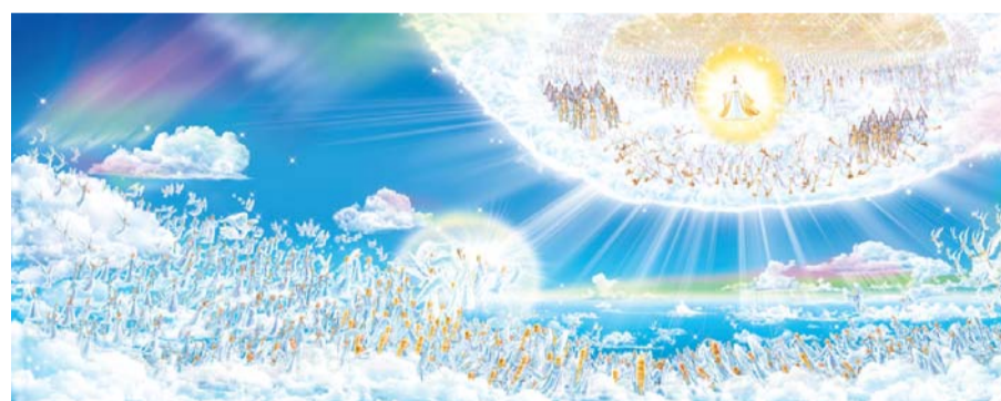
“주께서 호령과 천사장의 소리와 하나님의 나팔로 친히 하늘로 좇아 강림하시리니 그리스도 안에서 죽은 자들이 먼저 일어나고 그 후에 우리 살아남은 자도 저희와 함께 구름 속으로 끌어올려 공중에서 주를 영접하게 하시리니 그리하여 우리가 항상 주와 함께 있으리라” (데살로니가전서 4:16~17)

십자가의 섭리를 온전히 이루시고 부활 승천하신 주님께서 “하늘로 가심을 본 그대로 오시리라”(행 1:11) 했다. 또한 성경은 공중 강림하실 주님의 모습에 대해 “불지여다 구름을 타고 오시리라”(계