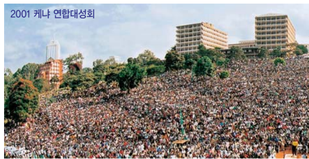
2001 케냐 연합대성회

하나님께 속한 권능은 언제나 그 열매가 선하여 영혼들을 구원에 이르도록 인도하며 하나님께 영광을 돌리게 합니다. 악한 원수 마귀 사단은 사람을 미혹해 하나님을 대적하게 하지만, 하나님께서 인간의 생사화복과 인류 역사를 주관하고 무에서 유를 창조하는 권능의 역사는 결코 흉내 낼 수 없습니다. 그러면 권능이란 무엇이며 하나님께 속한 권능의 역사는 어떻게 분별할 수 있을까요?