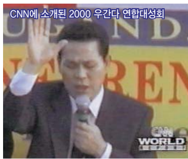
CNN에 소개된 2000 우간다 연합대성회