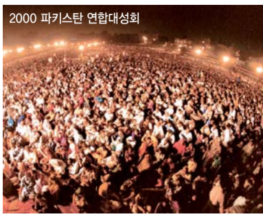
2000 파키스탄 연합대성회