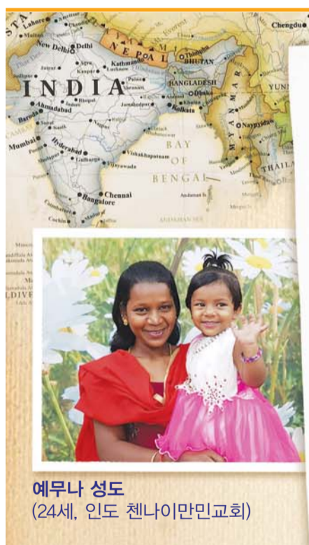
예무나 성도 (24세, 인도 첸나이만민교회)