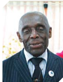
샤를 겔라니 목사 (전 세계 아프리카선교연합 대표)

생명의 말씀을 통해 감동을 주시고 마음을 새롭게 하시니 감사드립니다. 비전을 주시고 진리를 깨우쳐 주심도 감사드립니다. 이러한 목회자 세미나에 참석하게 되어 참으로 행복합니다. 성령님은 우리 곁에 서 우리에게 말씀하시는 분이며, 우리는 우리에게 말씀하시는 성령님의 모든 음성을 들어야 하고 모든 일에 있어서 성령님과 대화해야 함을 깨달았습니다. 귀한 말씀을 통해 성결에 대한 강한 사모함을 갖게 해 주심에 감사드리며, 이 시대에 우리에게 꼭 필요한 말씀을 전해 주심에도 감사드립니다.