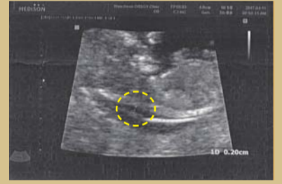
▲ 기도받은 후 : 4.12 mm로 두꺼웠던 태아의 목 피부 두께가 2 mm로 줄어듬.