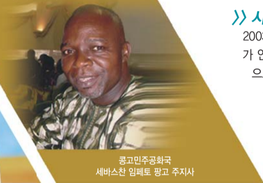
콩고민주공화국 세바스찬 임페토 광고 주지사

뿐만 아니라 다운증후군 고위험군 판정을 받은 태아가 이 목사의 기도로 정상으로 태어나는다면, 태아의 성별이 바뀌는 재창조의 역사도 일어나고 있다(만민뉴스 617, 618호 참조).