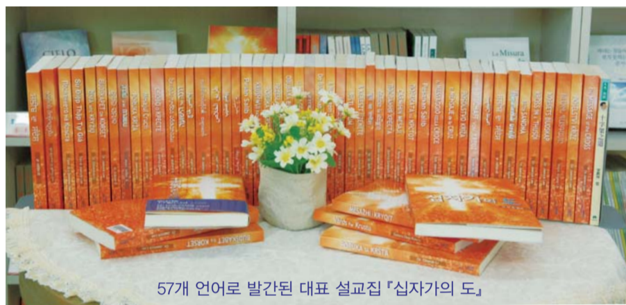
57개 언어로 발간된 대표 설교집 『십자가의 도』

또한 다 같은 천국 처소에 들어가는 것이 아니라 각자 믿음의 분량(롬 12:3)에 따라 처소가 구분되고 상급과 영광이 달라지는 것도 알려주셨습니다. 얼굴과 머리, 몸, 의복은 어떠한지, 각 사람의 집은 어떻게 지어지고 어떤 상급이 주어지며 어떻게 살아가는지 구체적으로 풀어주셨지요. 막연히 좋은 곳, 아름다운 곳이 아니라 눈앞에 그려지고 손에 쥐어지는 것처럼 생생하게 천국을 느낄 수 있게 하셨습니다.