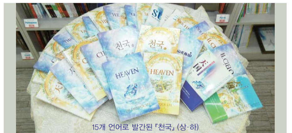
15개 언어로 발간된 『천국』(상·하)

요한일서 2장 14절에 나오는 '태초부터 계신 이를 아는 아버의 믿음'으로 성장해 나가지요.