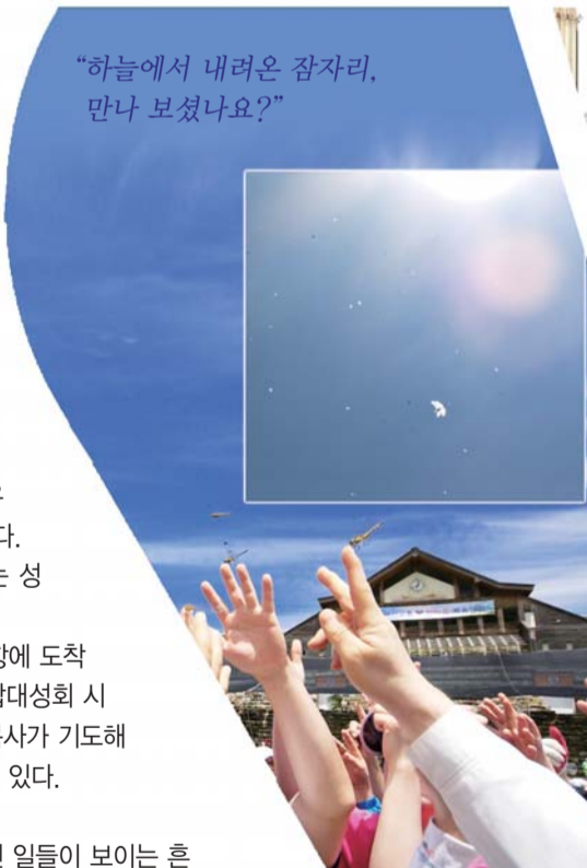
“하늘에서 내려온 잠자리, 만나 보셨나요?”