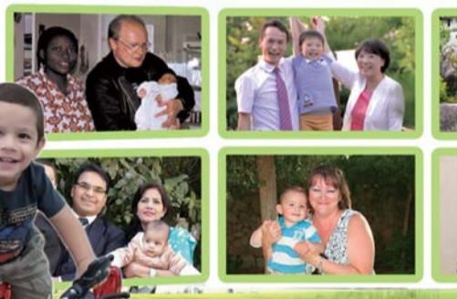
불임의 고통에서 잉태의 축복을 받은 국내외 성도