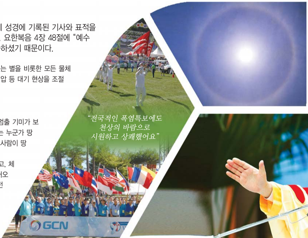
“전국적인 폭염특보에도 천상의 바람으로 시원하고 상쾌했어요”