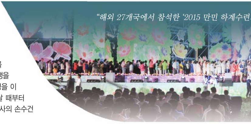
“해의 27개국에서 참석한 ‘2015 만민 하계수련회’